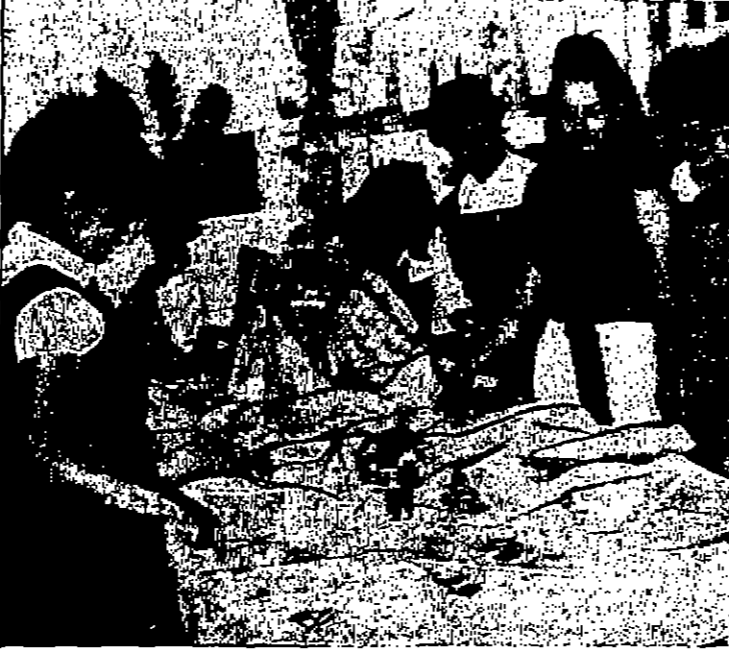
بنفسه نهاية العام الدراسي اتت المدرسة الاعدادية لاهين بسان « سي. ام. اس » بحرسا عرضت فيه مختلف نشاطات طلبة المدرسة من الشغالية وتعاون ورسوميات واعمال الخير التي من صنع طلبةها في مختلف الصفوف « تصوير سرياميس »

مدينة العريش - روبرت - أعلن ان تقامة اياما بولس في المسبح للكنائس الكاثوليك في القدس مساء السبت بلا من احد اعتبارا من الشهر القادم . ويهدف هذا الاجراء الى تسهيل الاجور على الأشخاص الذين يريدون الذهاب الى البحر او الجبل يوم الأحد .